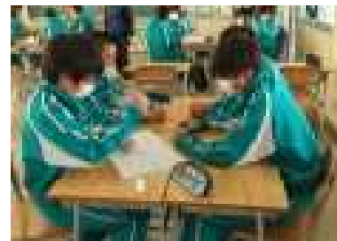
各学級でグループワークを通して「いじめ未然防止の授業」を行いました