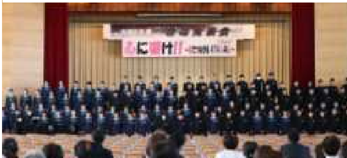
1学年合唱「大切なもの」