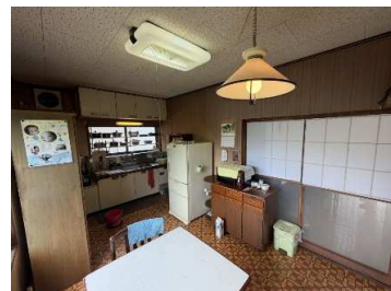
2階ダイニングキッチン