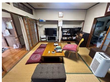
1階和室 8 帖