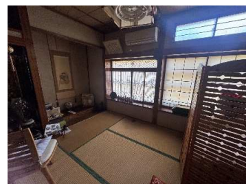
1 階和室 6 帖