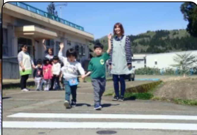
外にて、保育園前実際の横断歩道で渡る練習を行った。