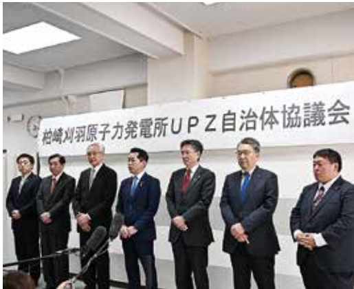
△4月14日(火)の第1回協議会の様子

4月14日(火)に、小千谷市長をはじめとする柏崎刈羽原子力発電所UPZ自治体の首長は、原子力防災の実効性の向上と、電源三法交付金制度の不均衡の見直しなどについて国へ提言・要望していくため、「柏崎刈羽原子力発電所UPZ自治体協議会」を設立し、第1回協議会を開催しました。