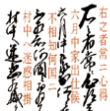
△「池ヶ原村 天保五午年二月文書」の原文と翻刻

■問い合わせ／ホントカ。 ☎82・2724 📧bunkazai@city.ojya.niigata.jp