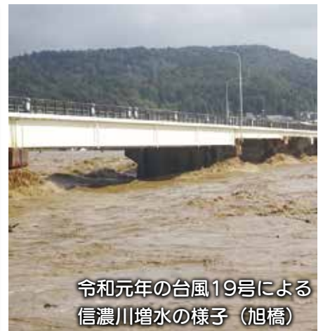
令和元年の台風19号による信濃川増水の様子（旭橋）