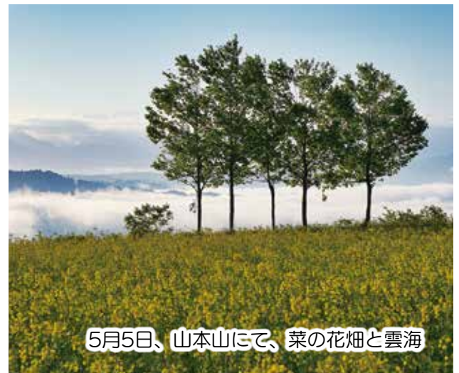
5月5日、山本山にて、菜の花畑と雲海