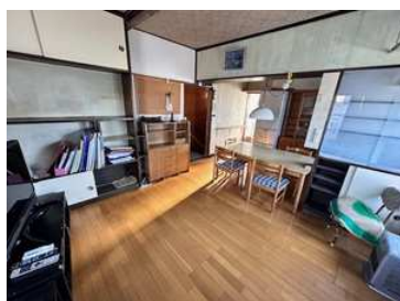
2階リビングダイニング