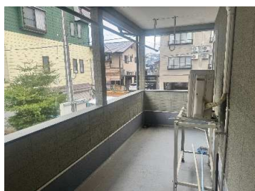
2階ベランダ (物干あり)