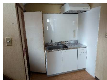
ミニキッチン (鉄骨部)