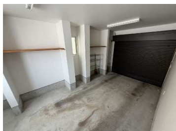
インナーガレージ