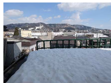
東側(信濃川方面)眺望