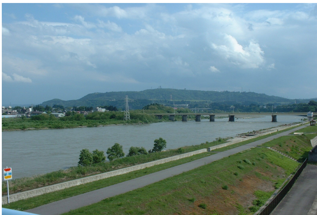
小千谷取水場水管橋より信濃川、山本山を望む

小千谷市は、水道水の水質検査の適正化や透明性の確保のため、法令に基づき地域性を踏まえた水質検査を実施しておりますが、このたび、令和8年度の水質検査計画を策定しましたので公表いたします。