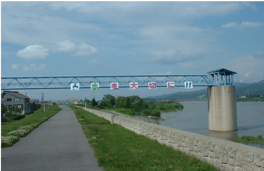
小千谷取水場水管橋