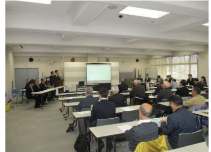
勉強会の様子(令和7年11月19日開催)

勉強会では、小千谷市より協議会の役割についての振り返りをするとともに、事業目的の一つであった新潟県の河川整備計画の策定が達成されたことを踏まえ、今後協議会として取り組む内容等についての確認と説明をしました。