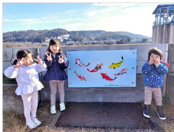
花壇に設置した錦鯉のパネル