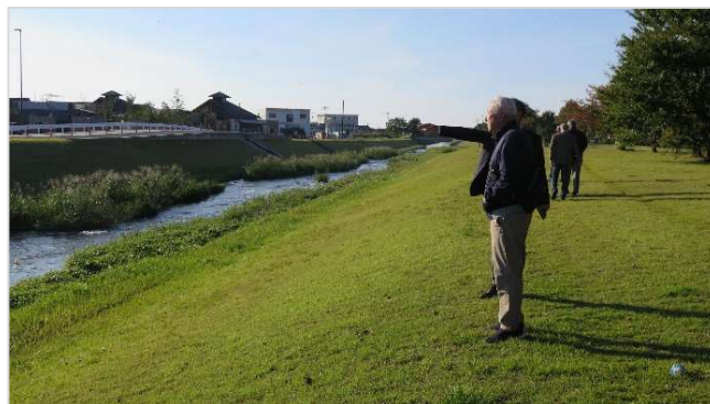
高橋川の現地視察

視察先は、富山県黒部市で活動する「高橋川を愛する会」です。高橋川は茶郷川と同規模の河川で、黒部市総合公園にも隣接し、公園と一体となった市民の憩いの場を形成しています。同会では、草刈りやごみ拾いに加え、河川を横断した鯉のぼりの掲揚など、多様な活動が行われており、参加者からは今後の茶郷川における環境整備や河川愛護活動の参考になったと報告がありました。