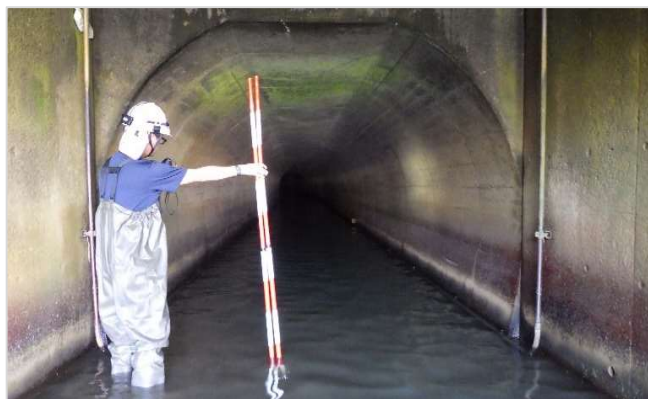
旧1号トンネル現地踏査の様子

現在、小千谷市への譲渡に向けて協議を進めている三古用水旧1号トンネル（管理：北陸農政局信濃川左岸流域農業水利事務所）について、小千谷市建設課職員により現地踏査を行いました。