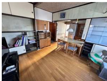
2階リビングダイニング