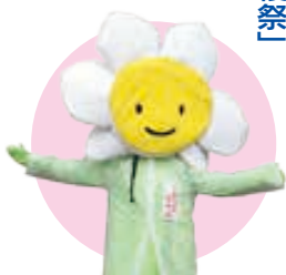
▲ふれあいの里キャラクター すいせんちゃん