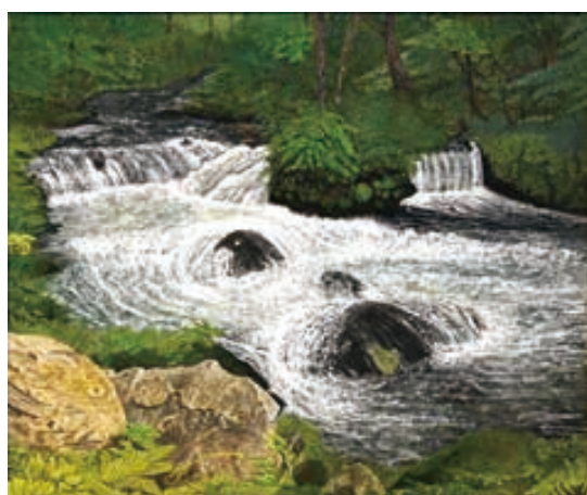
▲洋画・版画の部：水口正明『流れ 奥入瀬にて』