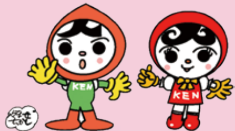
人KENまもる君 人KENあゆみちゃん