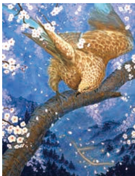
▲日本画の部：馬場春月『花嵐』