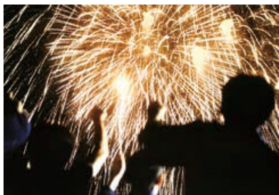
▲写真の部：野田弥希『夜爆ぜる』