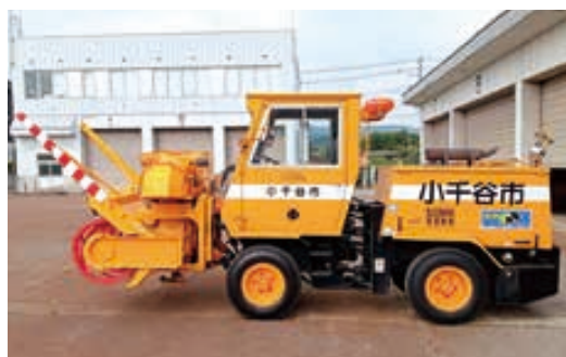
△小形ロータリ除雪車