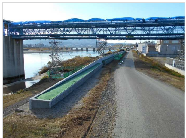
今年度分施工完了後

来年度に残り半分の花壇の設置と芝生の復旧、花の植栽を実施し、完了となります。工事の際はご不便等おかけいたしますが、ご理解とご協力の程よろしくお願いいたします。