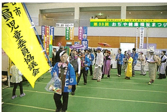
(おぢや健康福祉まつり PR活動の様子)

小千谷市民生委員児童委員協議会 (事務局) 小千谷市 福祉課 生活福祉係 電話 0258-83-3517