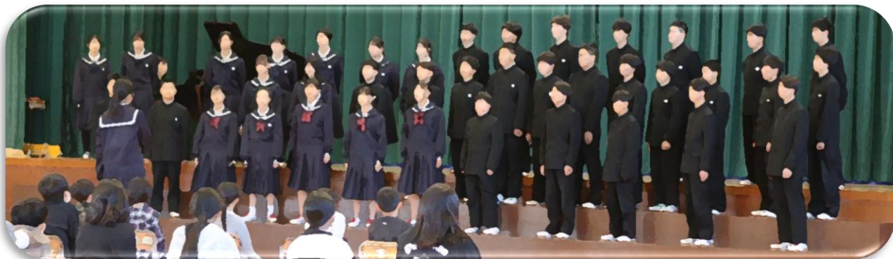
全校合唱「浪漫飛行」