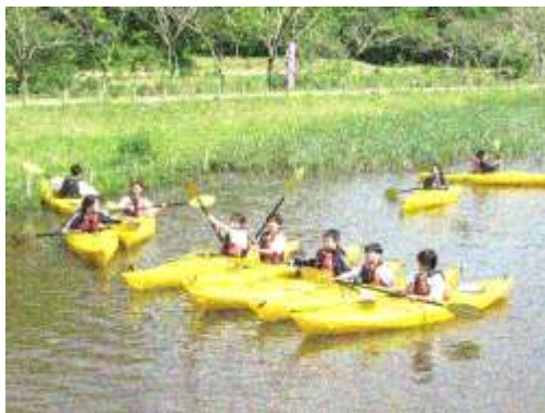
一人一台カヌー体験

どの活動も初めての経験である生徒がほとんどで、緊張感の中にも興味をもって取り組み楽しんでいました。自然体験教室を終えて帰ってきた1年生は、少し日に焼けてたくましく見えました。