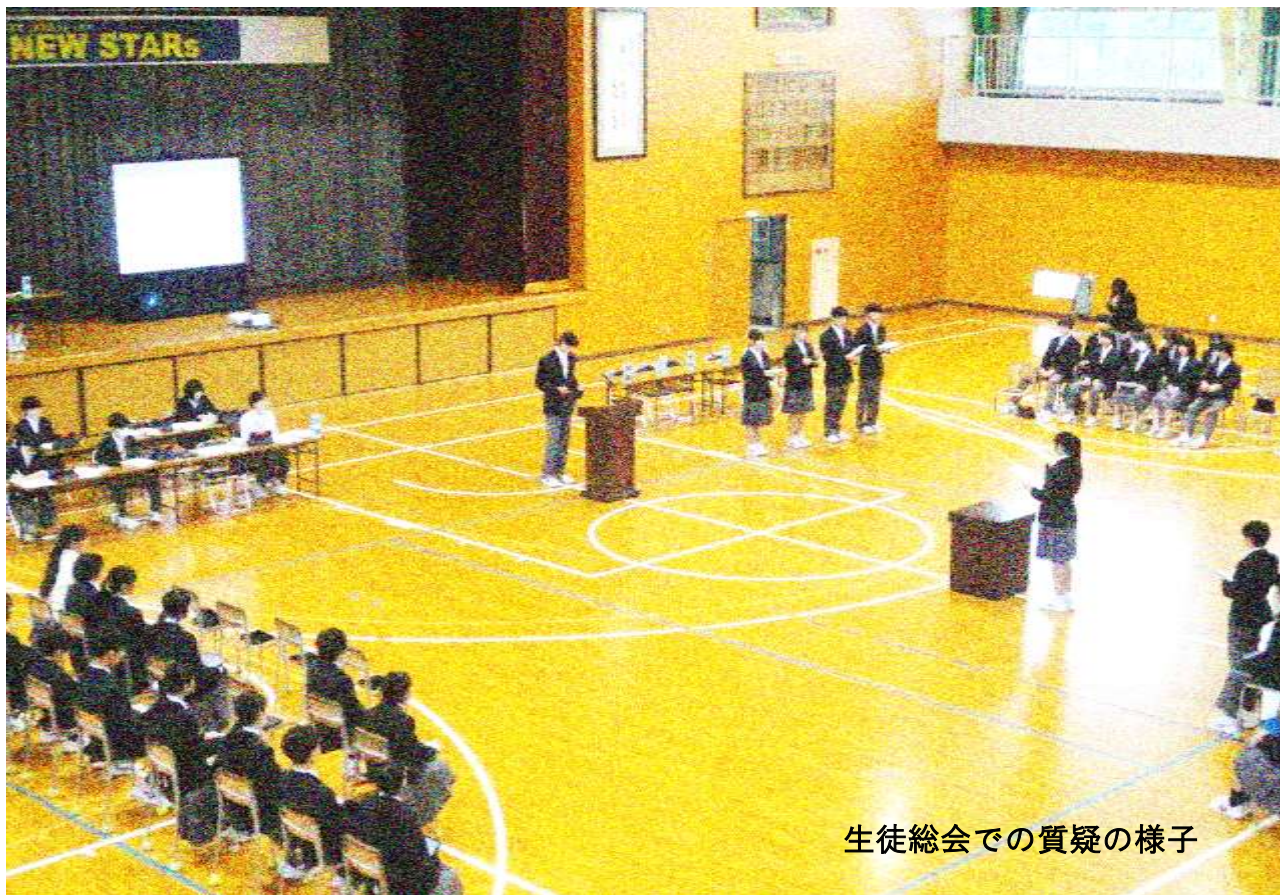
生徒総会での質疑の様子

ゴールデンウィークが終わり、最高気温が25度を超える夏日となる日も増えてきました。先日お知らせした通り今年度から衣替えをなくしましたので、子どもたちにはその日の気候に適した服装を考えて登校してほしいと思っています。月の終わりには今年度初めての定期テストがあります。計画的にそして集中して学習に取り組む時期となっています。